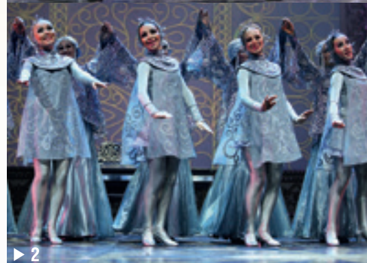
► 1 – Ювелирные мастера. ► 2 – Серебряные нити.

несколько лет, у зрителя появилась возможность увидеть элегантные костюмы, выполненные с точностью ювелирных изделий, в новом исполнении. Заметим, что в этом комплекте серебряная коротена, отделанная вручную из нитей серебра и жемчуга, приобрела удивительной красоты авторскую роспись по ткани.