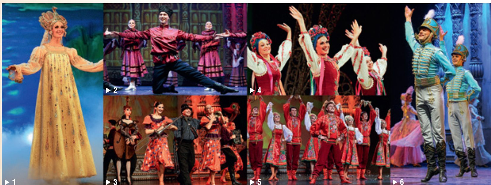
▶ 1 – «Озерко-Озерце». 2006г. ▶ 2 – «Большой Казачий Пляс». 2014г. ▶ 3 – «Село Петешное». 2008г. ▶ 4 – «Плескач». 2006г. ▶ 5 – «Праздничная». 2008г. ▶ 6 – «Гусарская Молодецкая». 2013г.

П.К.: – Во-первых, балет стал моложе. Наверное, даже меньше надо уделять времени гриму – какой грим, если вокруг одни молодые лица! Ну, исключая меня, конечно (смеётся). И на гастролях мы стали образцово-показательным коллективом, всё отработано, идёт, как часы! И, разумеется, программа меняется, становится интереснее не только для зрителя, но и