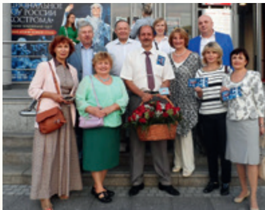
► Костромское землячество на спектаклях балета в Москве. 2018г.