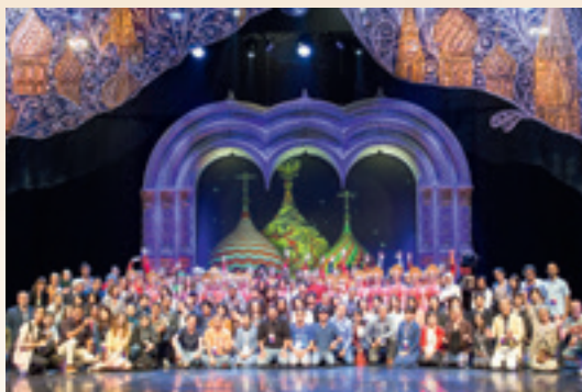
► Участники Всемирной Ассамблеи выпускников программы «Корабль молодежи мира» («Ship for world youth») – SWYAA Global Assembly. 2019г.

Е.Ц.: – Это было 100 концертов. Три месяца без выходных. Постоянная работа, мучительные поиски концепции новой программы, многочасовые репетиции. Артисты очень повзрослели. Они вместе с нами завоевывали Москву. Иногда им приходилось выступать перед тридцатью зрителями, тогда как их на сцене было пятьдесят, ездить перед вечерним Шоу на дневные выступления по различным мероприятиям столицы. Нужны были деньги, и мы зарабатывали их вместе. Первый сезон показал, насколько сплоченный и преданный у нас коллектив – друг другу, нам и, конечно, танцу. Я поняла, что вместе мы сможем двигаться дальше.