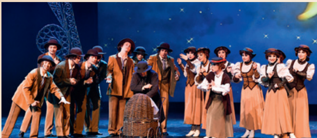
► «Первая прогулка».

– Итак, для тебя и твоего коллектива есть очень интересный проект. Ефим готовит большое театральное действо под названием «Песни еврейского местечка». Предполагается масштабное представление со сменой декораций, с использованием видеопроекции и лазерной анимации, а также с участием симфонического оркестра кинематографии под управлением Сергея Скрипки.