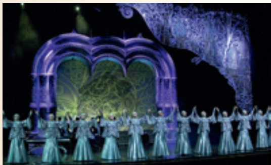
► «Теплота сердечная – сканью называется» (музыка В. Корнева, хореография Ю. Царенко).

Все видели «девушку в серебре», самый узнаваемый образ «Русского национального балета «Кострома», используемый на рекламной продукции проекта «Национальное Шоу России «Кострома». Но не многие знают, что известный бренд сошел на афиши со сценической площадки, а именно, с хореографической композиции «Теплота сердечная сканью называется». В странах, где гастролировал балет, этот номер считали символом балета и его визитной карточкой.